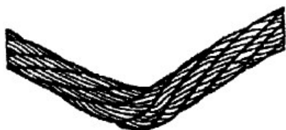
Рисунок 7. Перегиб каната

По остальным параметрам браковку канатов производить согласно Приказу 461 об утверждении ФНП "Правила безопасности опасных производственных объектов, на которых используются подъемные сооружения".