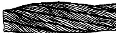
Рисунок 4. Местное увеличение диаметра каната