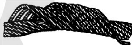
Рисунок 2. Корзинообразная деформация