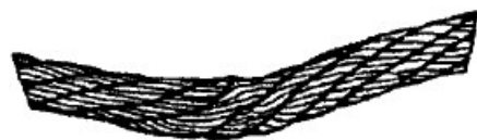
Рисунок 6. Залом каната