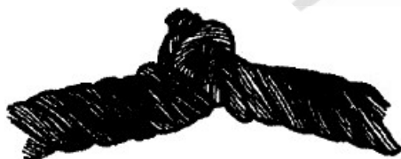
Рисунок 3. Перекручивание каната